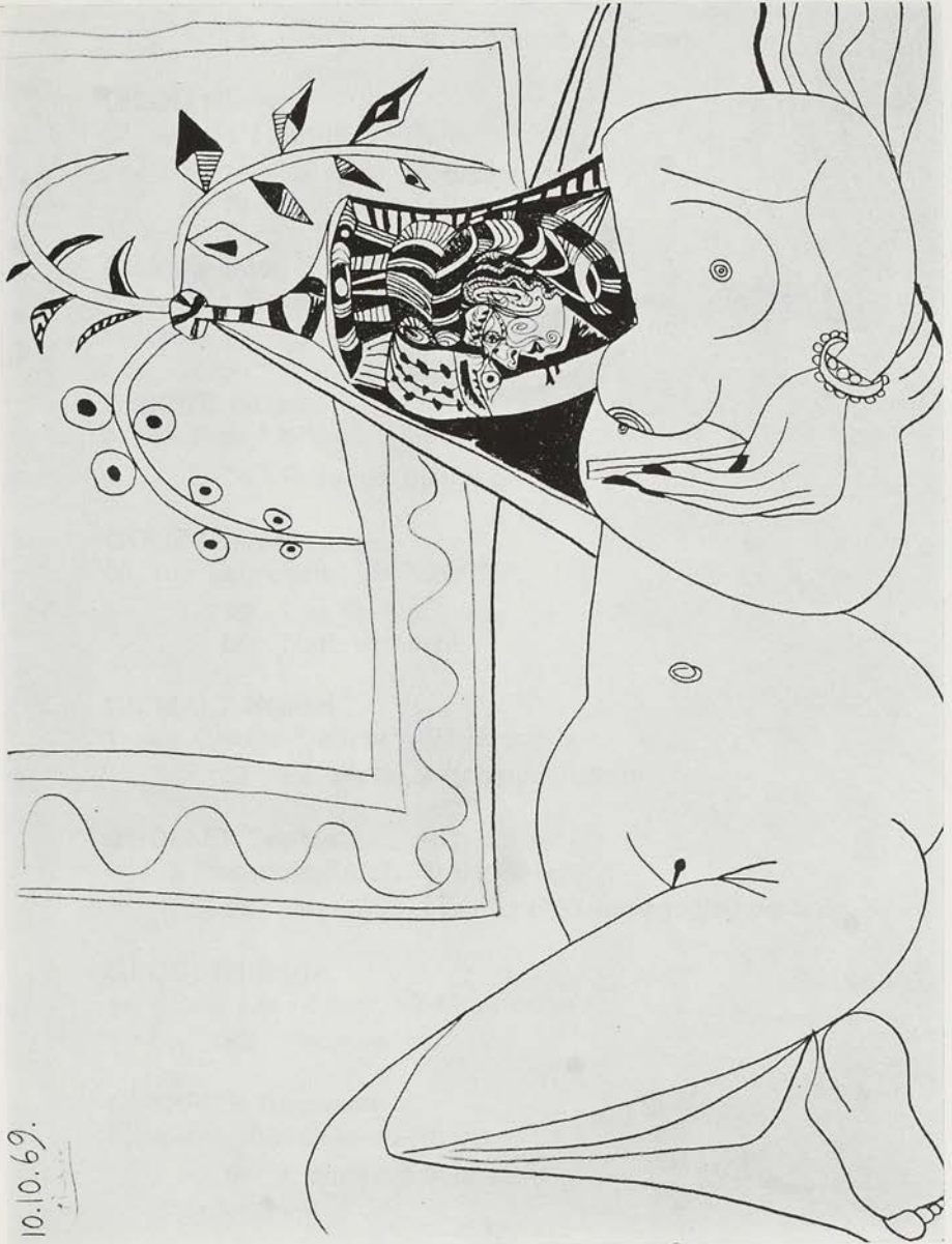
P. Picasso - Femme couchée (1969).