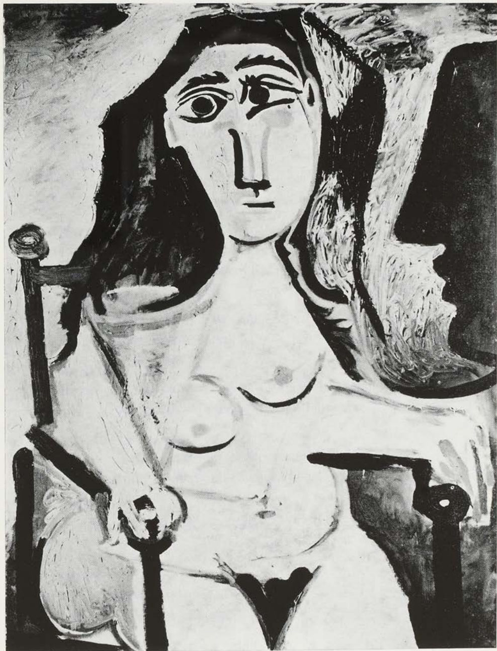
P. Picasso - Femme nue assise (1963).