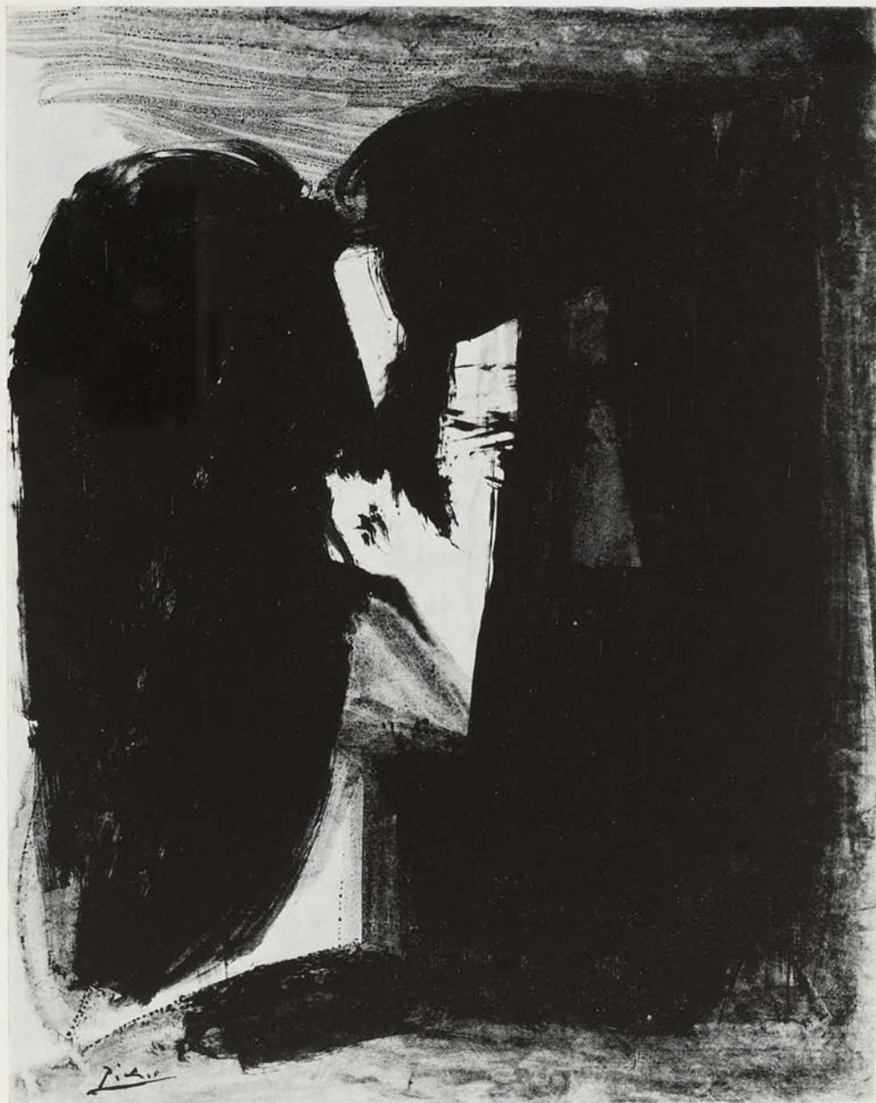
P. Picasso - Profil de femme au ruban (1963).