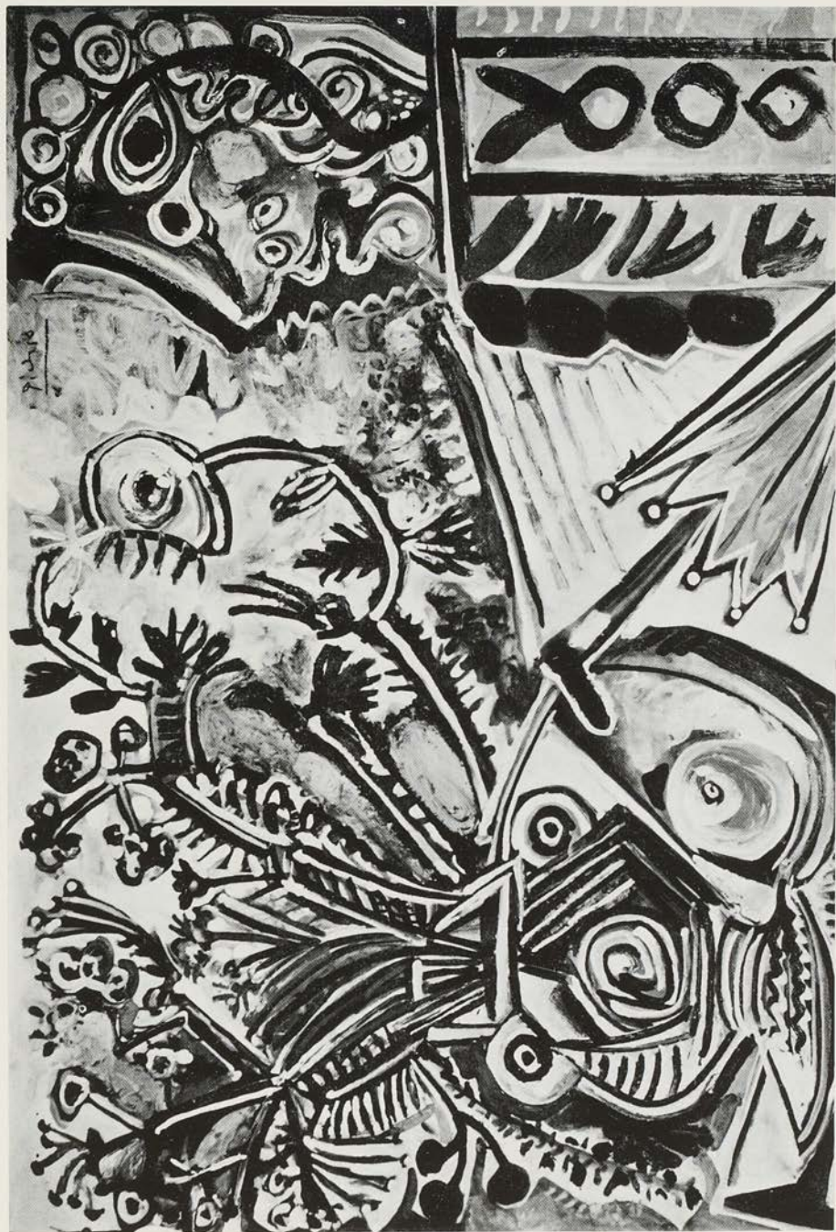
P. Picasso - Nature morte au parapluie (1968).