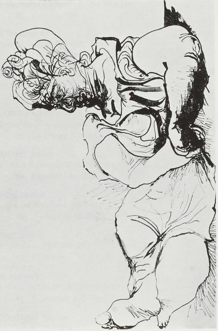
P. Picasso - Femme couchée (1970).