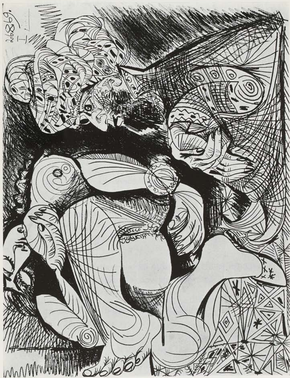
P. Picasso - Femme nue et homme au turban (1969).