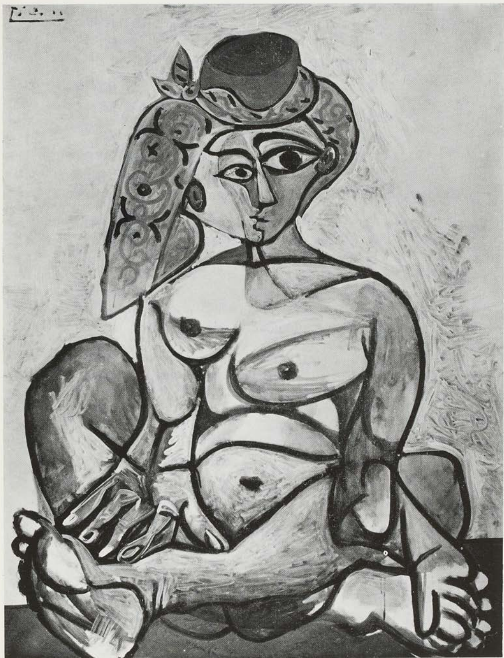
P. Picasso - Femme nue au bonnet turc (1955).