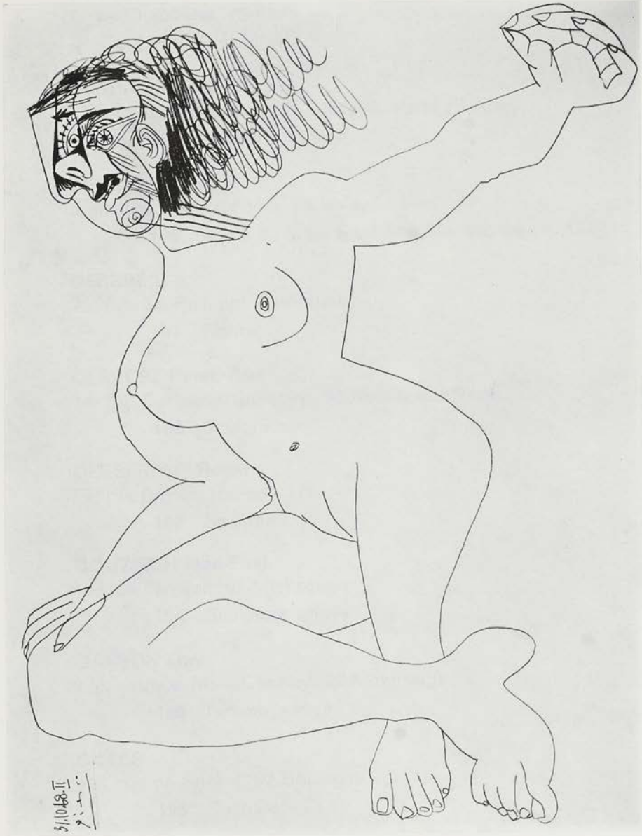
P. Picasso - Femme couchée (1968).