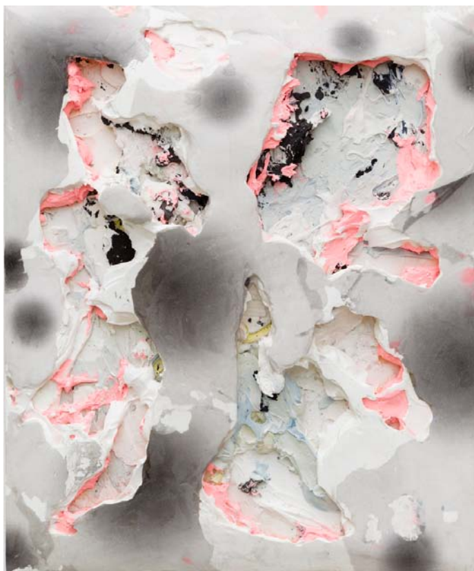
Nicolas Roggy, Sans titre , 2014, gesso, pigments, peinture acrylique, modeling paste et impression jet d'encre sur PVC, 34,8 x 45 x 5,8 cm.

Alors, est-il encore possible de parler d'abstraction aujourd'hui, quand tout signe visuel semble rentrer immédiatement dans une chaîne de significations ? « Nous ne voyons finalement que ce que nous comprenons, dit l'artiste Nicolas Roggy lui-même. Nous avons déjà une collection d'images dans la tête quand nous regardons une peinture ». Quelque part, elle « rend compte au spectateur de ce qu'il peut être ». L'idée d'une autonomie du tableau, sans aucun lien avec le monde, semble donc derrière nous. La peinture de Roggy a plutôt la capacité de nous interroger à travers des choix formels sur des questions abstraites, au-delà de l'anecdote d'un thème ou d'un sujet. Les questions sont travaillées dans la matière : ses tableaux donnent l'impression d'être un champ de bataille. « Je veux que l'attention que je porte aux étapes d'une réflexion soit visible », dit-il. Quelle est la part du hasard et de la décision ? Est-il possible de contrarier le désir d'ordre ? Est-ce que l'informe nourrit l'angoisse de ne pas savoir ce que l'on doit regarder ? En quoi l'accident peut apporter un élément de « véracité » (car, selon lui, il n'y a pas de vérité en peinture) ?