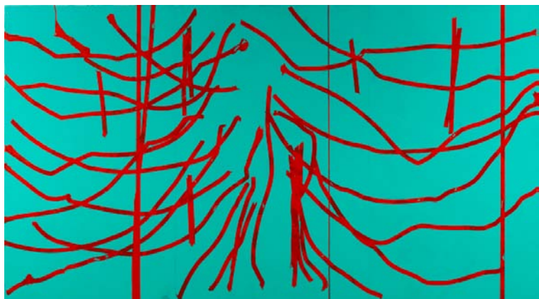
Nicolas Roggy, Sans titre , 2015, gesso, pigments, modeling paste sur PVC, 200 x 360 cm.

techniques du bâtiment ou de l'architecture, tout comme dans des matériaux de type enduit ou ciment ou dans des couleurs mates, sans vernis. Nicolas Roggy s'arrange toujours pour y projeter des bribes de