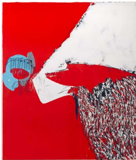
Nicolas Roggy, Sans titre , 2015, gesso, pigments, peinture acrylique, modeling paste sur bois, 200 x 238 cm.

Texte publié dans le cadre du programme de suivi critique des artistes du Salon de Montrouge, avec le soutien de la Ville de Montrouge, du Conseil général des Hauts-de-Seine, du ministère de la Culture et de la Communication et de l'ADAGP.