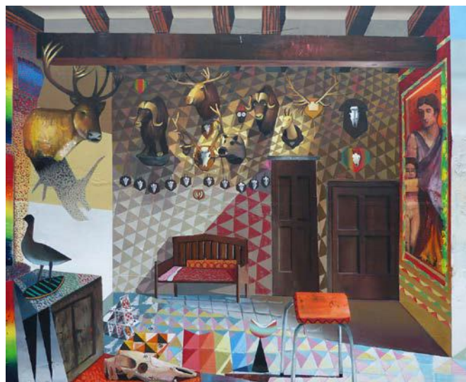
Mathieu Cherkit, Castle , 2015, huile sur toile, 170 x 210 cm, collection privée.

Texte publié dans le cadre du programme de suivi critique des artistes du Salon de Montrouge, avec le soutien de la Ville de Montrouge, du Conseil général des Hauts-de- Seine, du ministère de la Culture et de la Communication et de l'ADAGP.