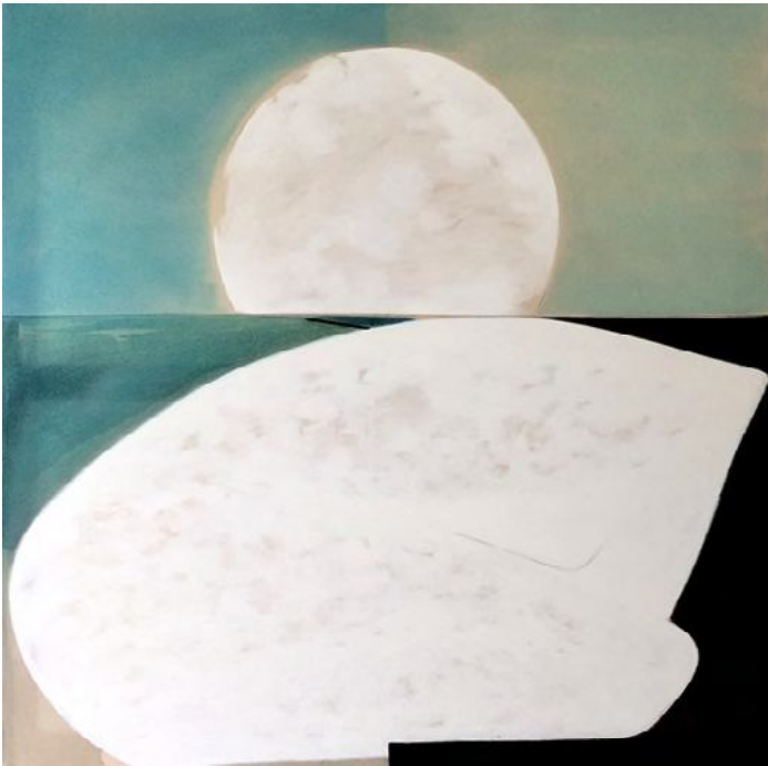
Julie Beaufiles, Untitled , 130 x 130 cm, huile et encre sur toile, 2017.

La plasticienne, née en 1987 à Paris, capte des états d'âme qu'elle inscrit dans le temps. De ce principe, elle fait jaillir des peintures qui sont comme une série d'émotions suspendues et assemblées.